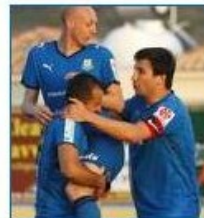
Ομόνοια-Ανόρθωση: Για Νέγκρι και ... 447 x 480 - 31k - jpg www.sigmalive.com [ More from www.sigmalive.com ]