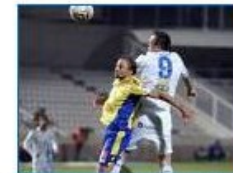
Ανόρθωση: Με 7 απόντες η προπόνηση . 644 x 480 - 34k - jpg www.sigmalive.com