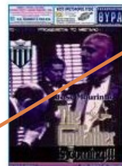
... της Ανόρθωσης οι ποδοσφαιριστές ... 575 x 805 - 144k - jpg athkeiaseros.pblogs.gr

επιλογή μεγέθους (πολύ μεγάλες, μεγάλες, μικρές, κλπ.)