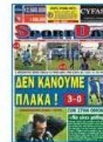
Πήρε Τικίνο η Ανόρθωση 227 x 314 - 95k - jpg www.sport-fm.com.cy [ More from www.sport-fm.com.cy ]